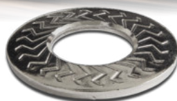
BN 208 010-8 Sperrkantscheiben