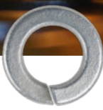
Mechanisch verzinkt, weiß