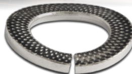
BN 208 012-6 Sperrkantringe