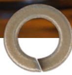
Mechanisch verzinkt, gelb, Cr6-frei