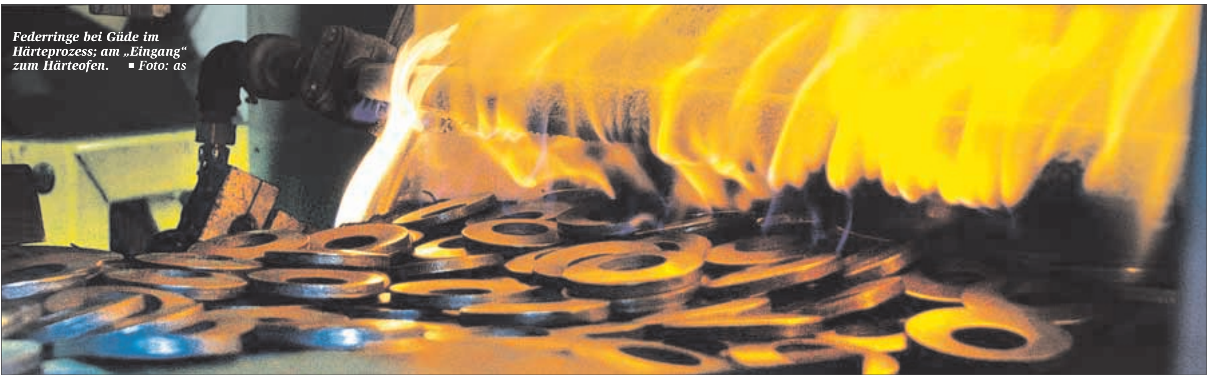
Federringe bei Güde im Härteprozess; am „Eingang“ zum Härteofen.