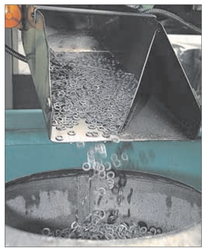
Ein nicht endender Strom von Draht-, Spreng- und Federringen kommt sortenrein aus der Härterei.

Und noch eines wurde klar: Kleine und große Unternehmen unterscheiden sich heute noch darin, ob sie eBusiness und moderne Technik haben oder nicht. Das Prozeus-Programm macht es möglich, dass kleine und mittlere Unternehmen mit begrenzten Mitteln den Anschluss schaffen und zu den Technologieführern aufschließen. ■ as