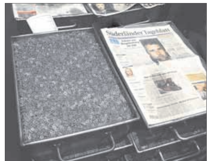
Das ist unser Plettenberg: Unzählige Federringe liegen zur Weiterverarbeitung bereit. Die Stahlkisten werden – um Schmutz fernzuhalten – mit Blättern der ausgelesenen Heimatzeitung abgedeckt.

Im Sortiment sind Federringe, Drahtbiegeteile sowie Schrauben- und Wellensicherungen. Standard- und Sonderstücke werden aus Federsählen, Nitrosta, Aluminium, Bronze und Sondergütern hergestellt. Als Familienbetrieb in dritter Generation legt man – so betont die Unternehmerfamilie – Wert auf eine langfristige Zusammenarbeit.